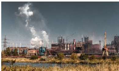
L'acciaieria Azovstal di Mariupol, dove gli ucraini hanno resistito ai russi

La famiglia Grigoli, che l'aveva fondata nel 2001, due anni dopo la cedette alla Leman Group. Metinvest acquistò la ferriera veronese nel 2007. Ma produceva molto poco, anche perché la sua gemella,